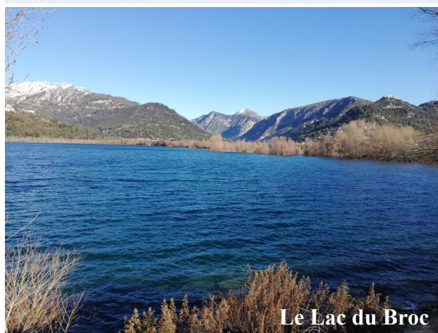
Le Lac du Broc

La Siagne est alimentée en amont par des sources magnifiques et par le lac de Saint Cassien (Département du Var). La richesse alimentaire des eaux de la grande Siagne assure une croissance rapide des espèces piscicoles présentes.