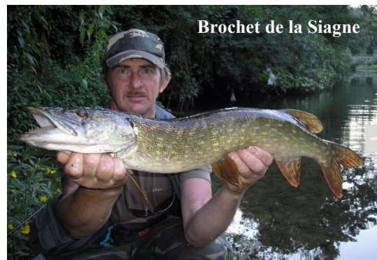
Brochet de la Siagne

La population piscicole dans ce superbe cours d'eau a été largement confortée suite à un plan de gestion piscicole réalisée par l'Association de pêche locale « Les Pêcheurs de la Basse Siagne ». Il offre aux pêcheurs la possibilité de pratiquer toutes les techniques. Il n'est donc pas rare de trouver des carnassiers tels que brochets, perches et Black-bass de belle taille.