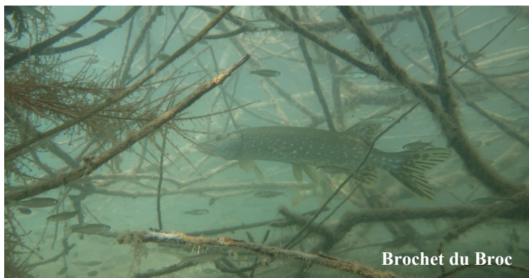
Brochet du Broc

Du côté nourriture, il n'est pas difficile, il peut aussi bien se nourrir de grenouilles, de poissons blancs, de ses congénères ou encore de poissons morts. Expert de l'embuscade, il sera généralement présent derrière un rocher, un herbier ou un arbre mort.