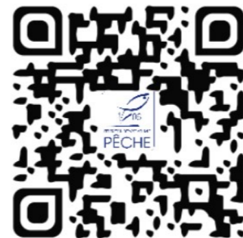
Cartographie interactive des parcours de pêche

Renseignements : 04 93 72 06 04 – www.peche06.fr